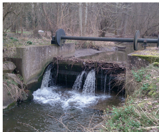
Le clapet d'Oulins (avant travaux)

Construite au fil de l'eau, la retenue d'eau de ce moulin était contrôlée par deux ouvrages mobiles :