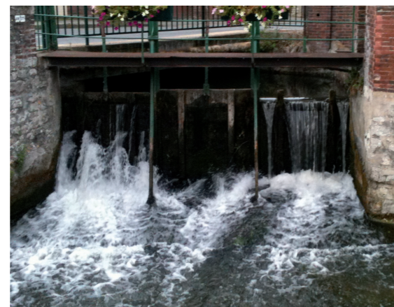
Le vannage de La Chaussée-d'Ivry (avant travaux)

Depuis, plus aucun moulin sur la Vesgre n'utilise l'énergie hydraulique pour laquelle ils ont été construits à l'origine et ont été transformés la plupart du temps en habitations.