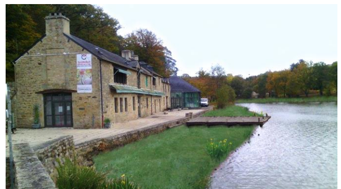
Photomontage de l'étang aménagé

Ces travaux sont financés par le département, la région et l'agence de l'eau Loire Bretagne.