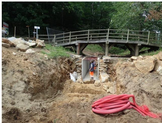
Aménagement de la prise d'eau du nouveau lit du St Gentien

Un dispositif de franchissement de la prise d'eau du nouveau lit sous la passerelle qui comporte une rampe latérale et des macro-plots avec une rugosité dans le fond du lit qui permet aux poissons de franchir le dispositif avant d'arriver au plan d'eau pour remonter ensuite les confluent.