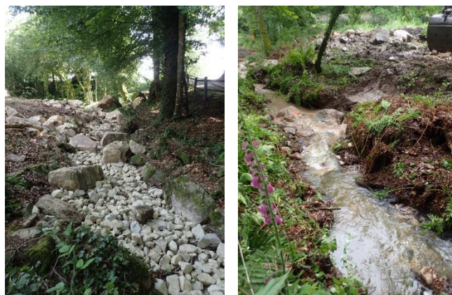
Nouveau lit du St Gentien en cours d'aménagement avant mise en eau et test en eau

L'utilisation d'un fossé de surverse de crue qui après abaissement de la retenue d'eau d'un mètre va permettre de contourner l'ouvrage hydraulique et recréer un nouveau ruisseau du St Gentien plus fonctionnel et attractif pour la libre circulation des poissons que les promeneurs pourront voir en longeant le chemin.