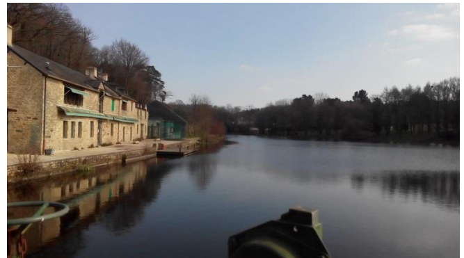
État initial de l'étang (mars 2016)