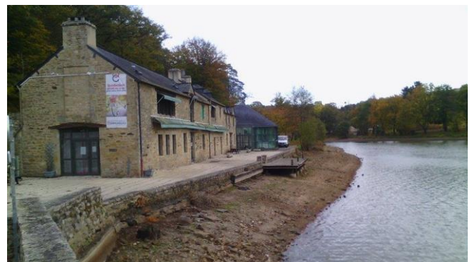
État à -1 m de l'étang (déc. 2016)