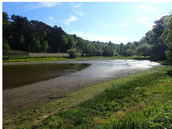
Prairies humides en cours de formation suite à l'abaissement de la retenue